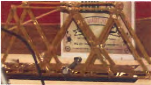
Şekil 1 Doğru