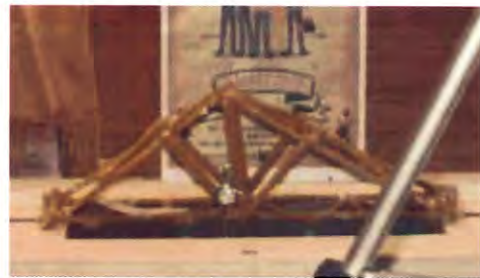
Şekil 2 Hatalı