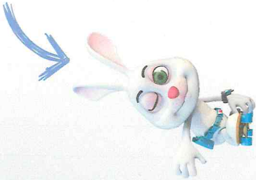
KARAKTER : AKILLI TAVŞAN MOMO