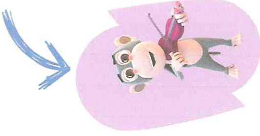
KARAKTER : YUMİ