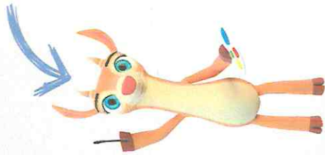
KARAKTER : KIKI