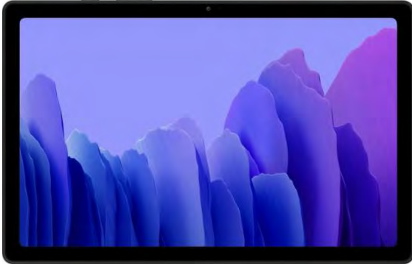
Samsung Galaxy Tab A7 SM-T500 32 GB 10.4" Tablet