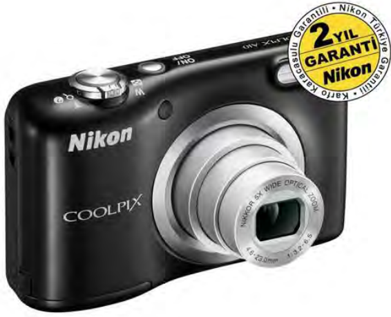
Nikon Coolpix A10 Black Dijital Kompakt Fotoğraf Makinesi