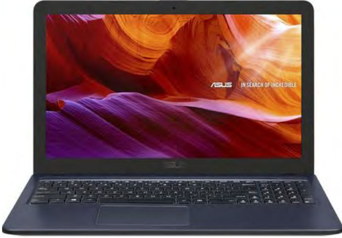
Asus F543NA-GQ339T Intel Celeron 4GB 128GB SSD Windows 10 Home 15.6" FHD Tařınabilir Bilgisayar