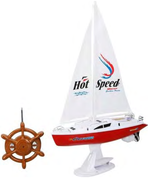
Suncon Uzaktan Kumandalı Yelkenli Tekne 38 Cm.